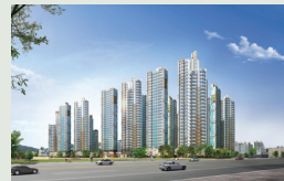
대구 월성 996세대