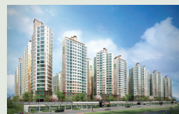
부산 명지 국제신도시 1664세대