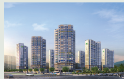
대구 이시아폴리스 752세대