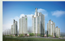
김해 진영 534세대