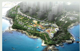
부산 용호 씨사이드복합리조트(예정)