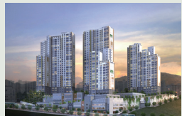
부산 시티즌파크 389세대