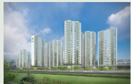
칠곡 왜관 606세대