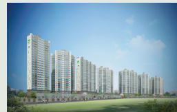
대구 태전 756세대