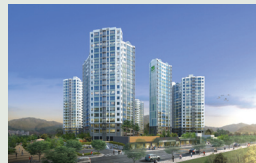
경주 황성 444세대