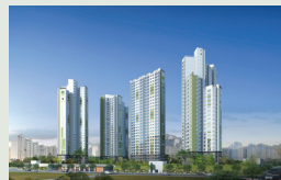
경산 대평 494세대