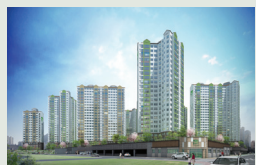
경주 용황 1588세대