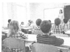
1. 검단신도시 초점도 2. 교통 3. 생활 4. 교육