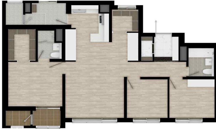
79B 확장 평면도