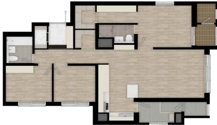
84 확장 평면도