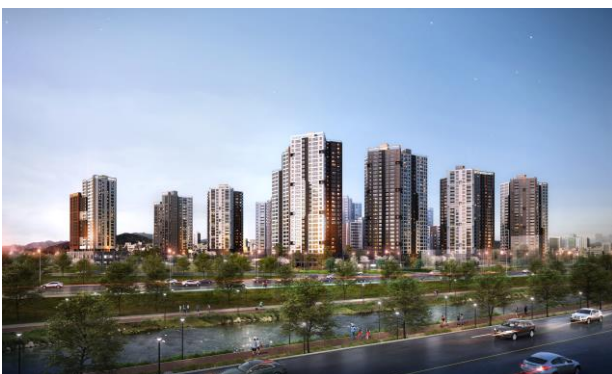
※ 상기 CG 이미지는 소비자의 이해를 돕기 위한 이미지 컷으로 실제와 다를 수 있습니다.

※ 청약 신청 시 내용은 청약자 본인에게 모든 책임이 있으므로, 청약 신청 전 반드시 상세 입주자모집공고의 내용을 숙지하시고 청약하시기 바랍니다.