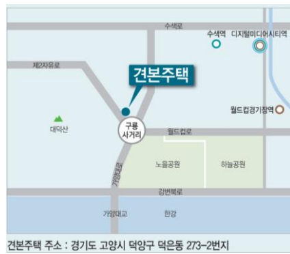
견본주택 주소 : 경기도 고양시 덕양구 덕은동 273-2번지