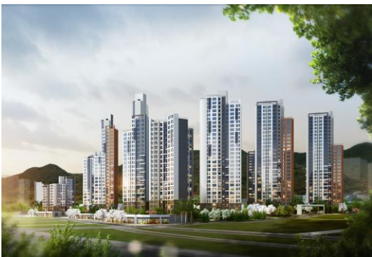
※ 상기 CG 이미지는 소비자의 이해를 돕기 위한 이미지 컷으로 실제와 다를 수 있습니다.

※ 청약 신청 시 내용은 청약자 본인에게 모든 책임이 있으므로, 청약 신청 전 반드시 상세 입주자모집공고의 내용을 숙지하시고 청약하시기 바랍니다.