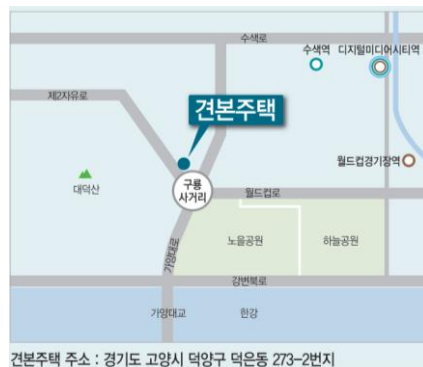
견본주택 주소 : 경기도 고양시 덕양구 덕은동 273-2번지

총 1,223세대 중 일반분양 453세대 (전용 59㎡, 74㎡, 84㎡)