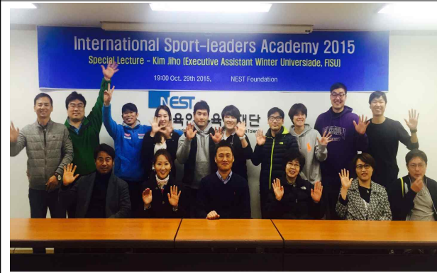
전문지식 - 해외초청자 강연