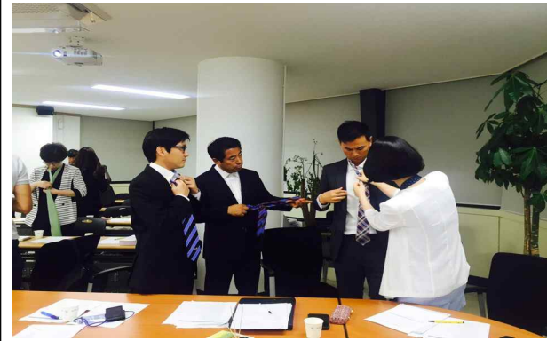
글로벌 매너 이미지 연출