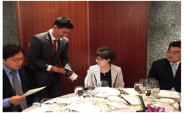
글로벌 매너 中 테이블매너 실습교육