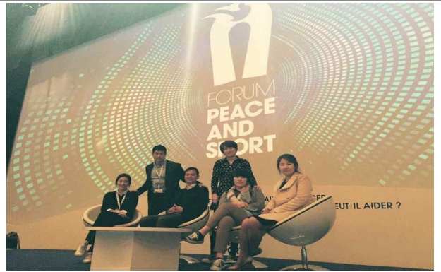
현장실습(Peace and Sport Forum)