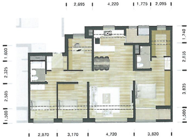
84B 단위세대 평면도(확장형)